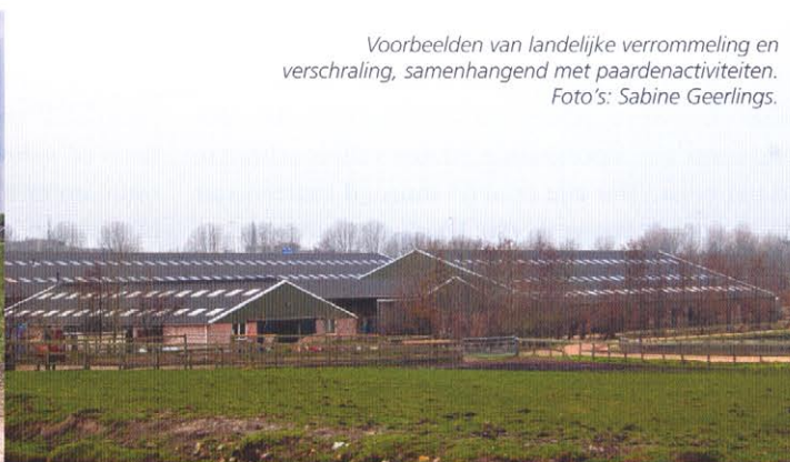
Voorbeelden van landelijke verrommeling en verschraving, samenhangend met paardenactiviteiten.